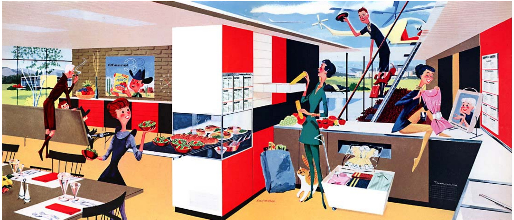
House of the Future | Fred McNabb | 1956

Internetinfrastrukturen zur Entwicklung des ländlichen Raums